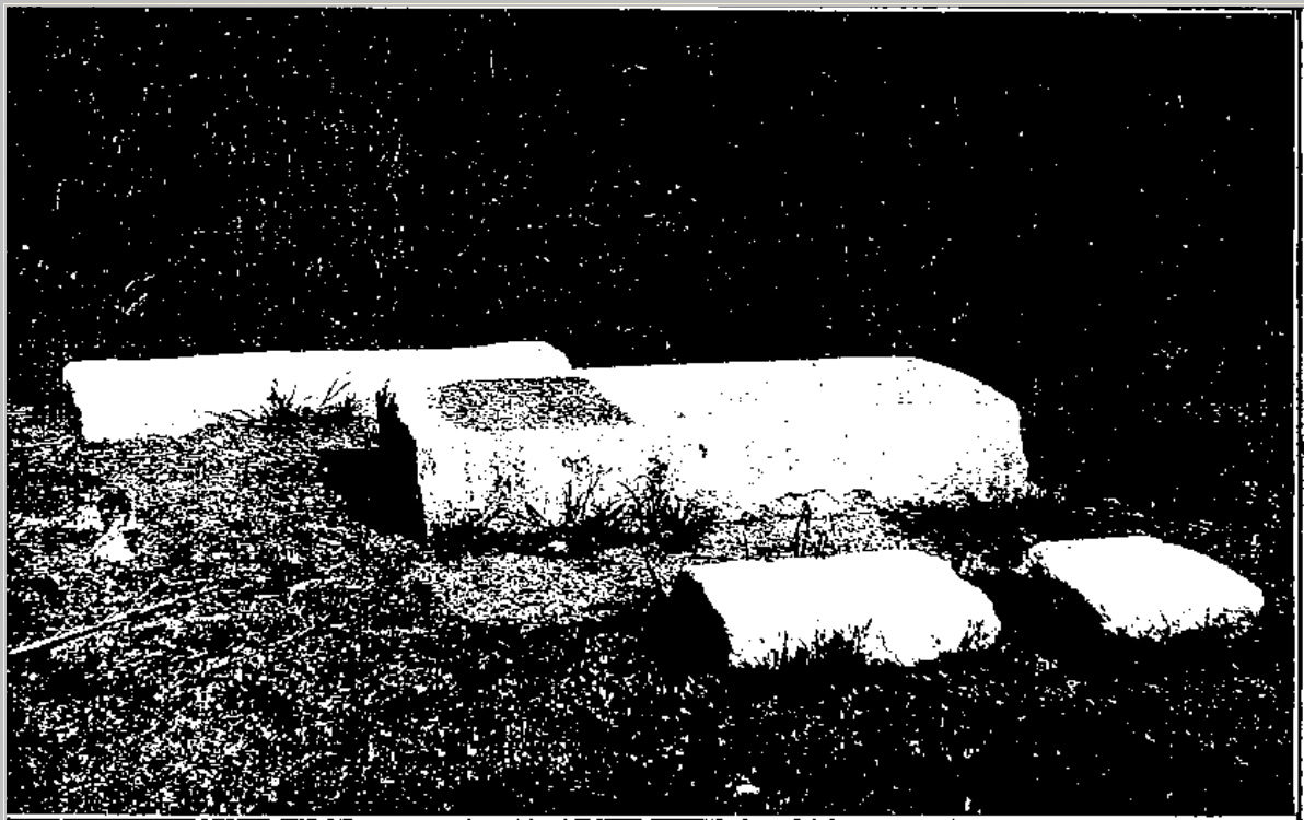
LE TOMBEAU DU « RAB », A TLEMCEM