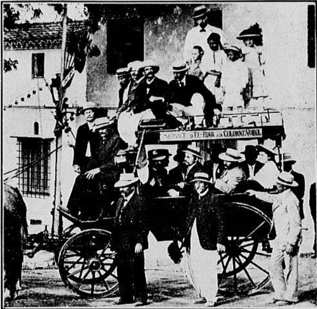
LA PETITE VOITURE QUI ASSURE LE SERVICE RÉGULIER D'EL-BIAR A LA COLONNE-VOIROL